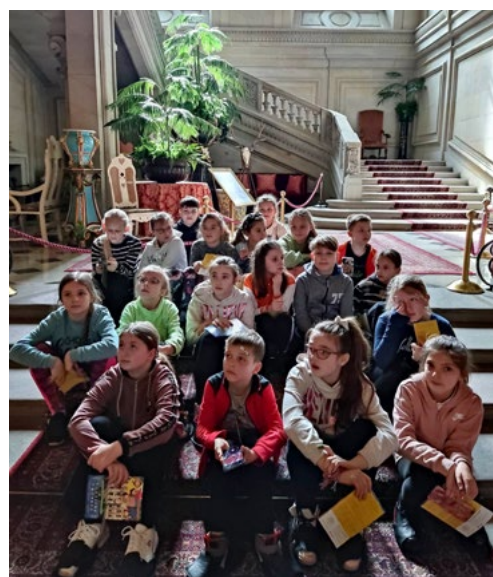
Zamek w Pszczynie