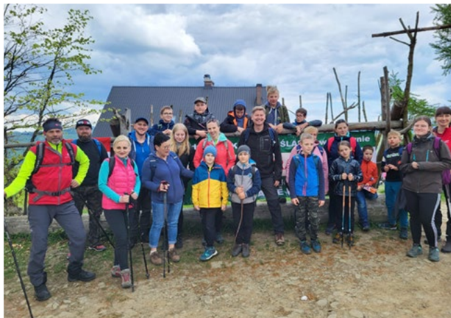
Rajd górski - Powitanie wiosny