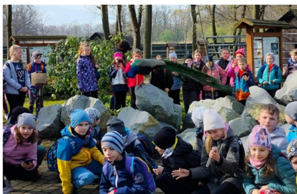
Wycieczka do Pszczyny