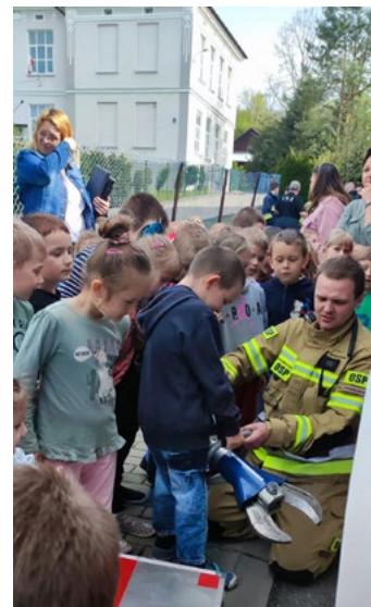
Pokaz sprzętu strażackiego przedszkolakom