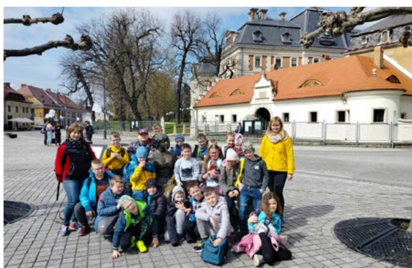
Klasa 2 z księżną Daisy