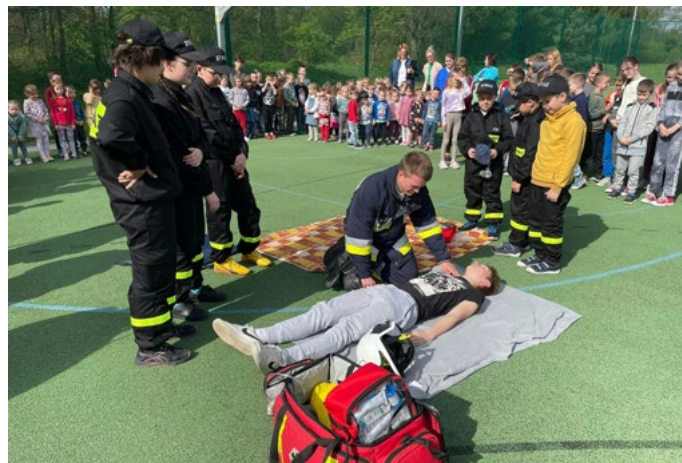
Pokaz udzielania pierwszej pomocy